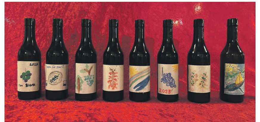
Kreative Seniorinnen und Senioren: Mit Flair und Liebe gestaltete Weinetiketten: Erfrischende Note mit unverwechselbarem Charakter!

Vom 21. bis 25. August war die fröhliche Reisegruppe – 27 Teilnehmende, 4 Begleitpersonen und Christine Kellenberger, Chauffeuse – in der Region um Susten-Leuk unterwegs.